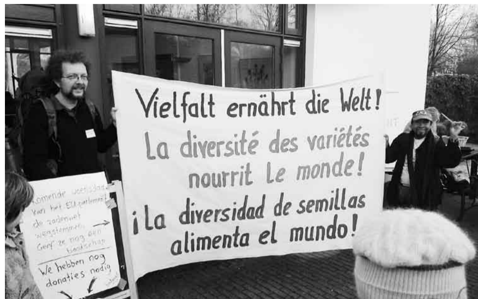
In de Hortus Haren werd kort voor de afstemming in het Europees Parlement over de nieuwe zadenwet nog opgeroepen tot protest tegen het wetsvoorstel.

Deze vernietiging van zaaigoed plus de massieve importen van gesubsidieerde levensmiddelen uit de VS en Europa sinds de vrijhandelsverdragen geldig zijn, hebben afgelopen