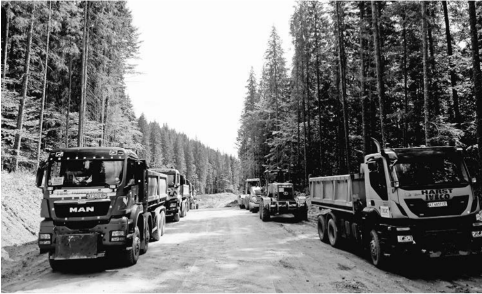
De verwoestingen in het natuurgebied van de Svydovets houden niet op.

Ons land wordt al meer dan anderhalf jaar geteisterd door oorlog en we weten niet hoe lang die nog zal duren. Terwijl sommige mensen aan het front staan, helpen anderen vluchtelingen in het binnenland. Helaas blijven tegelijkertijd de oligarchen profiteren van de situatie.