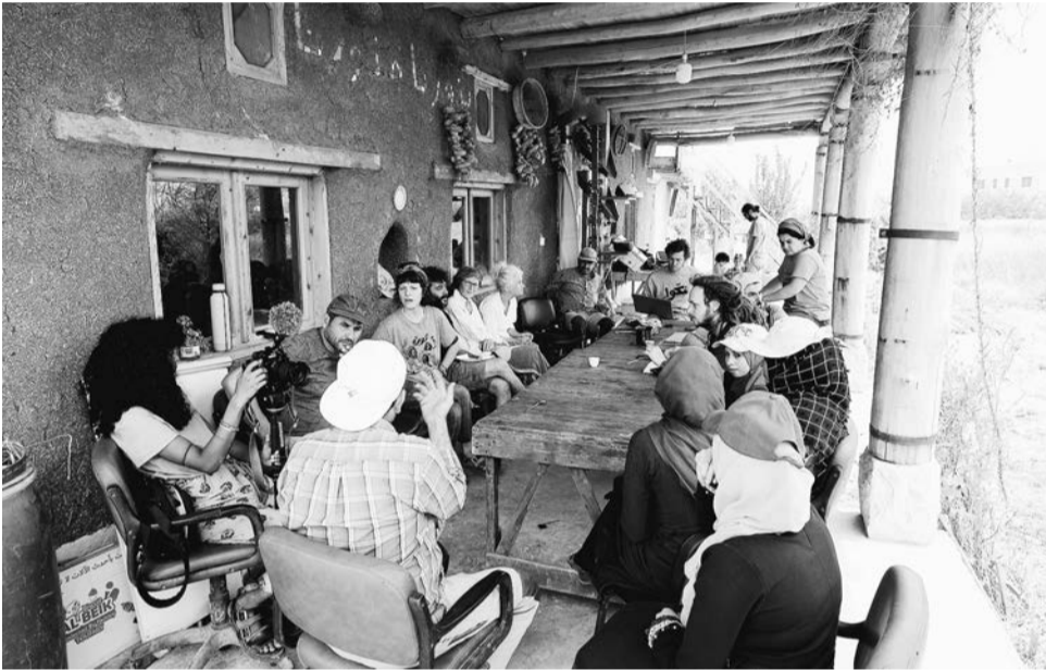
Elke maandagmorgen bespreken alle bij het project betrokken mensen en de bezoekers de activiteiten van de week onder het voordak van het zaadhuis.

Till woont in de Longo maï-coöperatie Mas de Granier in Zuid-Frankrijk. Hier zijn relaas over zijn onvergetelijke verblijf bij onze vrienden van Buzuruna Juzuruna in Libanon. Longo maï ondersteunt dit project sinds jaren.