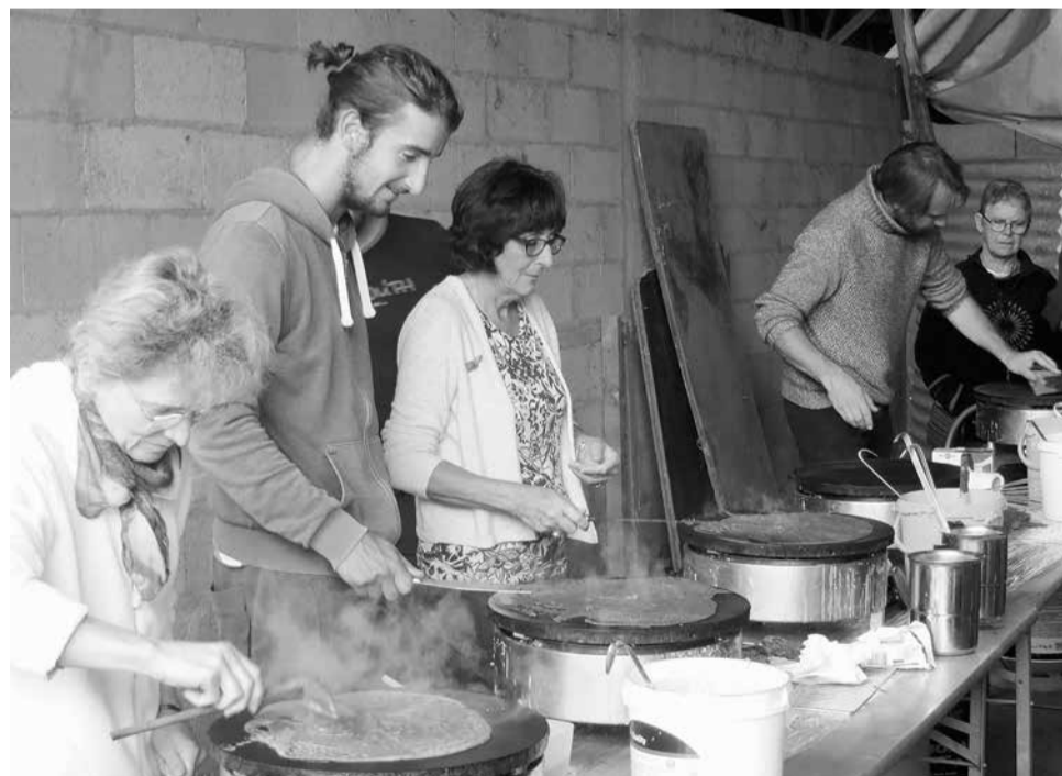
Open dag op een van de boerderijen op de ZAD. Ieder kan zijn eigen pannenkoek bakken.

steunvereniging een schenkingsfonds opgericht, een soort eenvoudige stichting, getiteld 'La terre en commun – gemeenschappelijk land'. Het doel van dit fonds is om de woon- en landbouwgebouwen die tijdens de jaren van de strijd 'bezet' waren, te kunnen kopen van het departement en de staat. Ook moeten alle gebouwen worden ge-