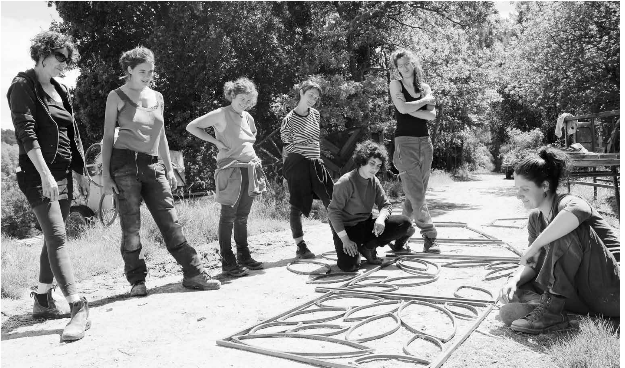
Met ernstige blikken en met trots wordt de toekomstige trapleuning voor de trap in de Cabrery in ogeschouw genomen.