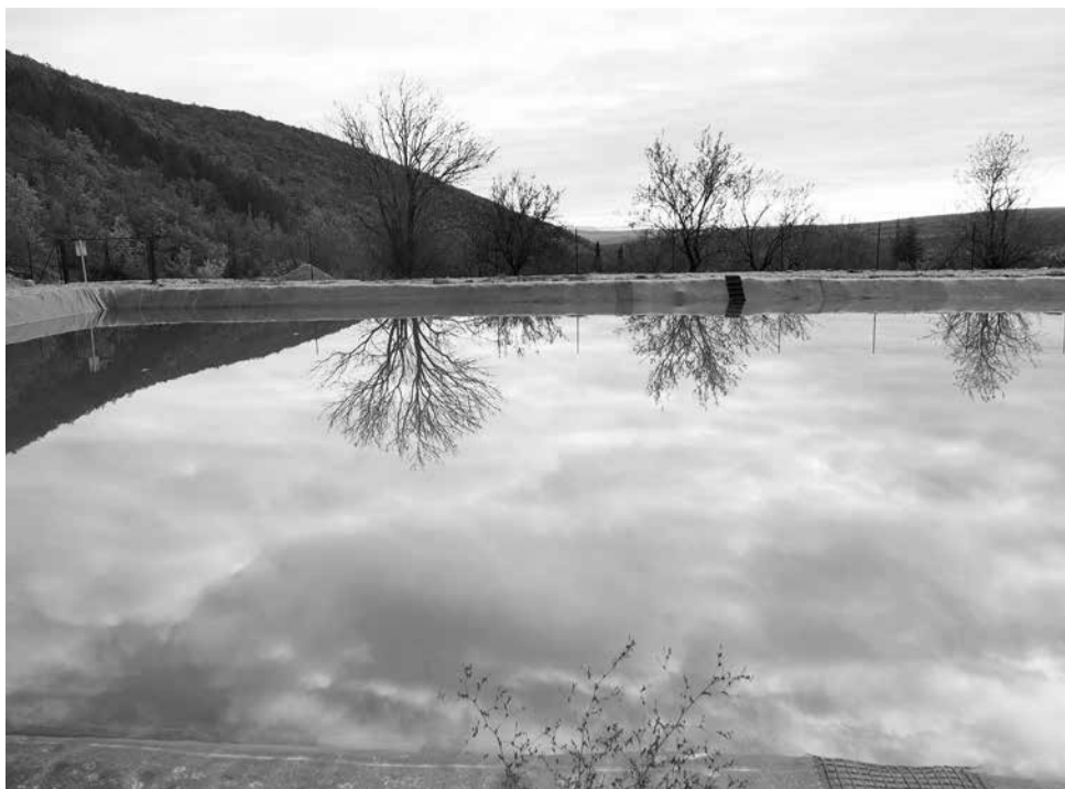
Het waterreservoir achter de amandelboomgaard van St. Hippolyte is lekker vol. De zomer kan komen!