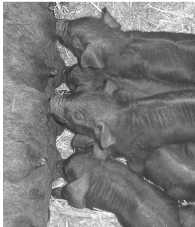
Het kan ook anders: een zeug van het oude ras Gas-cogne met haar biggen op de coöperatie in Limans.