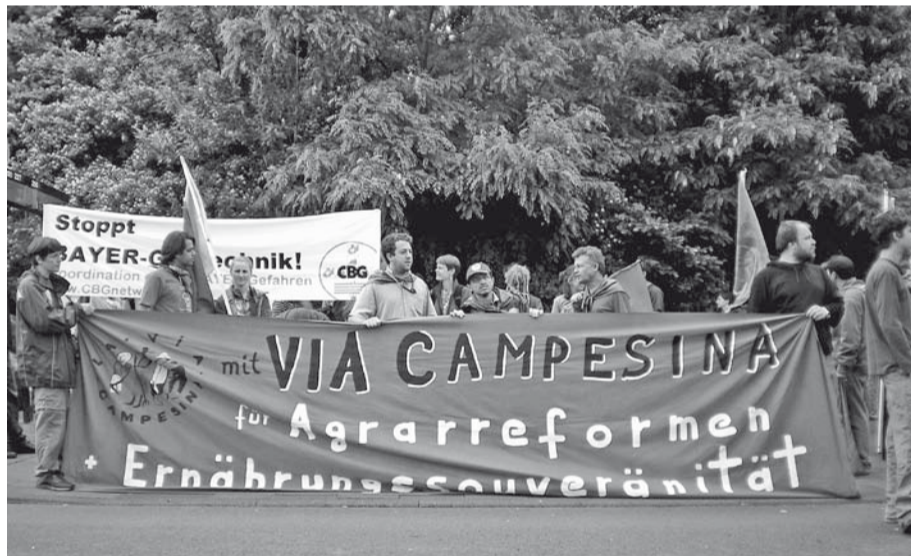
Vorig jaar protesteerden we tijdens de Conferentie over Biodiversiteit in Bonn met Via Campesina ondermeer tegen de patenten van Bayer op planten.

weging Via Campesina. In 1960 was per hoofd van de wereldbevolking nog 4.300 m 2 akkerland beschikbaar. Terwijl de wereldbevolking groeide, nam de verstedelijking toe. Er gaat ook steeds akkergrond verloren door de jarenlange intensieve verbouw die de bodem uitput. De productieve landbouwgrond is in 2005 per hoofd van de wereldbevolking tot 2.300 m 2 geslonken. Voor 2030 liggen de prognoses bij 1.800 m 2 . De akkerbouwgrond is een winstobject geworden. De prijzen stegen bijvoorbeeld in Groot-Brittannië en Brazilië in het eerste halfjaar 2008 met 20%. In Oost-Duitsland steeg sinds 1991 de prijs met 500%. De hongeropstanden van januari 2007 tot juni 2008 in meer dan 50 landen zijn bijna vergeten, verdron-