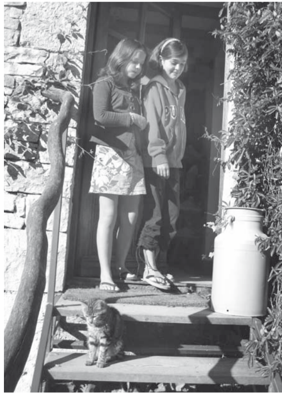
De melkboer is geweest! Voor een gemeenschap als Longo mai in de Provence is een grote melkkan nodig.